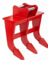
Hrable na korene