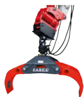
Kliešte na drevo