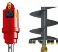
Vŕtacie zariadenie + Zemné vŕtaky