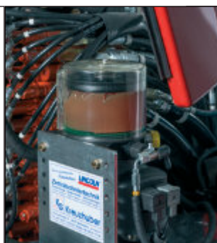
Centrální mazací systém s upozorněním při vyprázdnění maziva