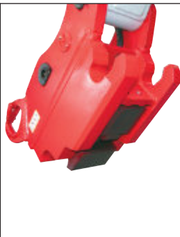
Hydraulická rychloupínací deska