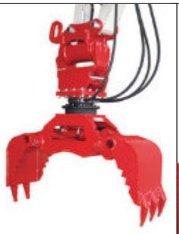
Naklápací hlava Powertilt s univerzálním drapákem