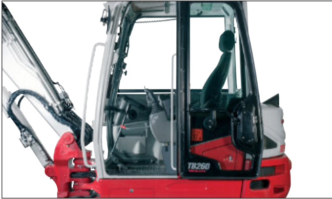
Prostorná kabina tlumící hluk a vibrace s úložnými prostory, široký vchod s masivním dorazem dveří, sklopné přední sklo, klimatizace ve standardní výbavě.