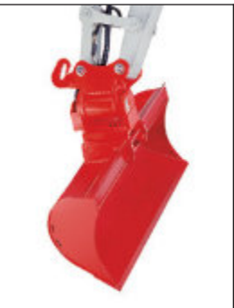
Pevná svahovací lopata s naklápací hlavou Powertilt