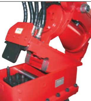
Systém Huppi-Quick: hydraulické okruhy jsou automaticky spojeny rychlospojkami