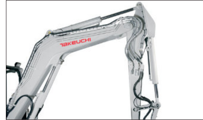
4 přídavné hydraulické okruhy, z toho 3 ovládané proporcionálně, regulovatelné průtoky na displeji.