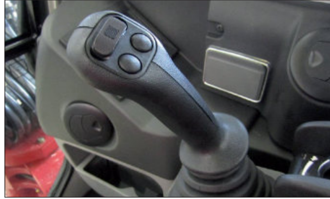
Proporcionální ovládání přídavných okruhů na levém i pravém joystiku.