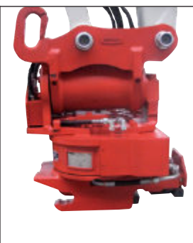
Rotační hlava Rototop s Powerlittem a hydraulických rychloupínačem