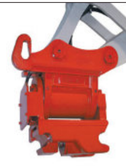
Powertilt s hydraulickým rychloupínačem