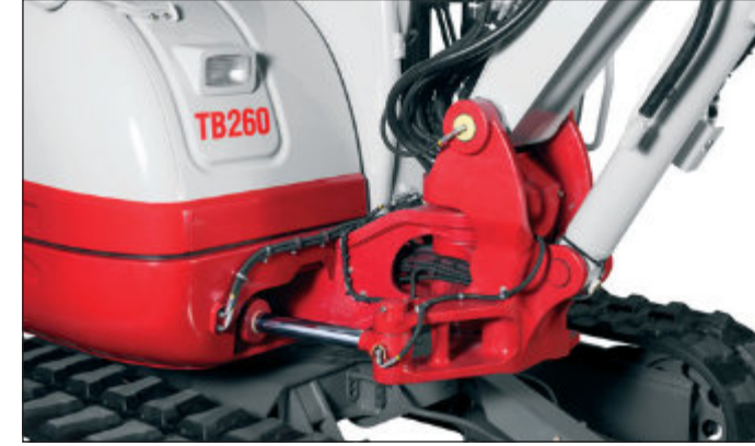
Robustní otočný kozlík. Dojezdové brzdy hydraulických válců. Zámky hydraulických válců součástí standardní výbavy.