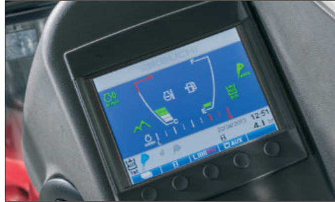
Přehledný displej přístrojové desky. ECO - režim ke zvýšení účinnosti a snížení spotřeby nafty..