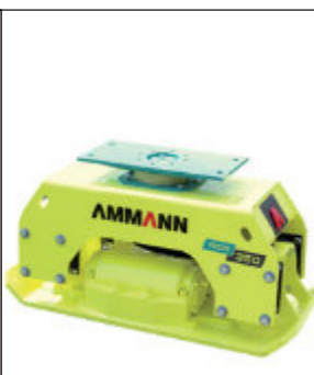
Přídavná vibrační deska