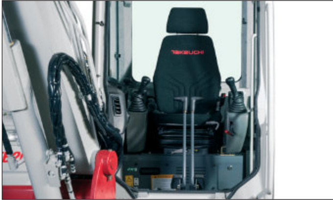
Ergonomické komfortní sedadlo s optimalizovaným rozmístěním ovládacích prvků pro pohodlnou práci bez únavy.